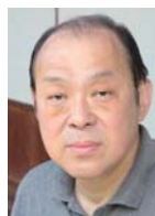
十五代 沈壽官 (テン・ジュカン、심수관)

早稲田大学大学院アジア太平洋研究科教授。 1953年韓国大邱市生まれ。国立ソウル大学中退後、82年来日。 国際基督教大学を卒業後、東京大学大学院法学政治学研究所 修士課程修了。法学博士(東京大学)。専門は国際政治学、現代 朝鮮半島研究。東北大学法学部助教授、立教大学法学部教授、 同副総長などを経て、2012年より現職。米国のプリンストン大学客員 研究員など歴任。